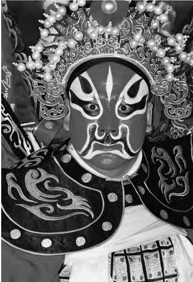
Παραδοσιακή κινέζικη όπερα