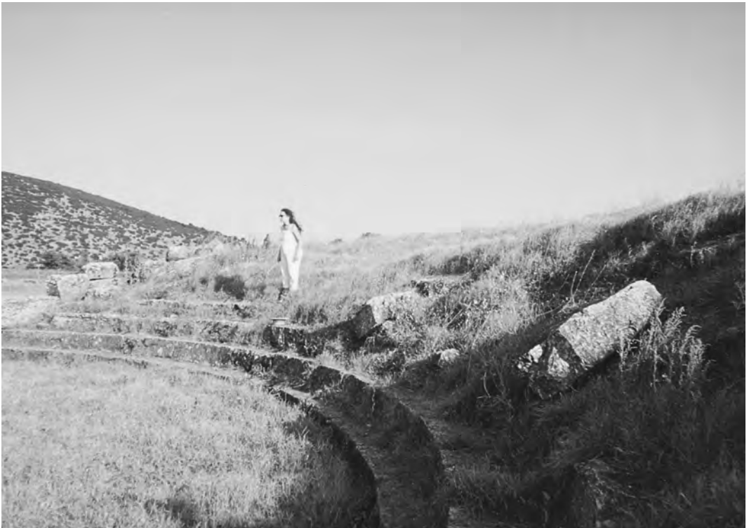
Ο φύλακας των χαλικιών, Αρχαίο θέατρο Μαντινείας, Αρχείο Μ. Φραγκή