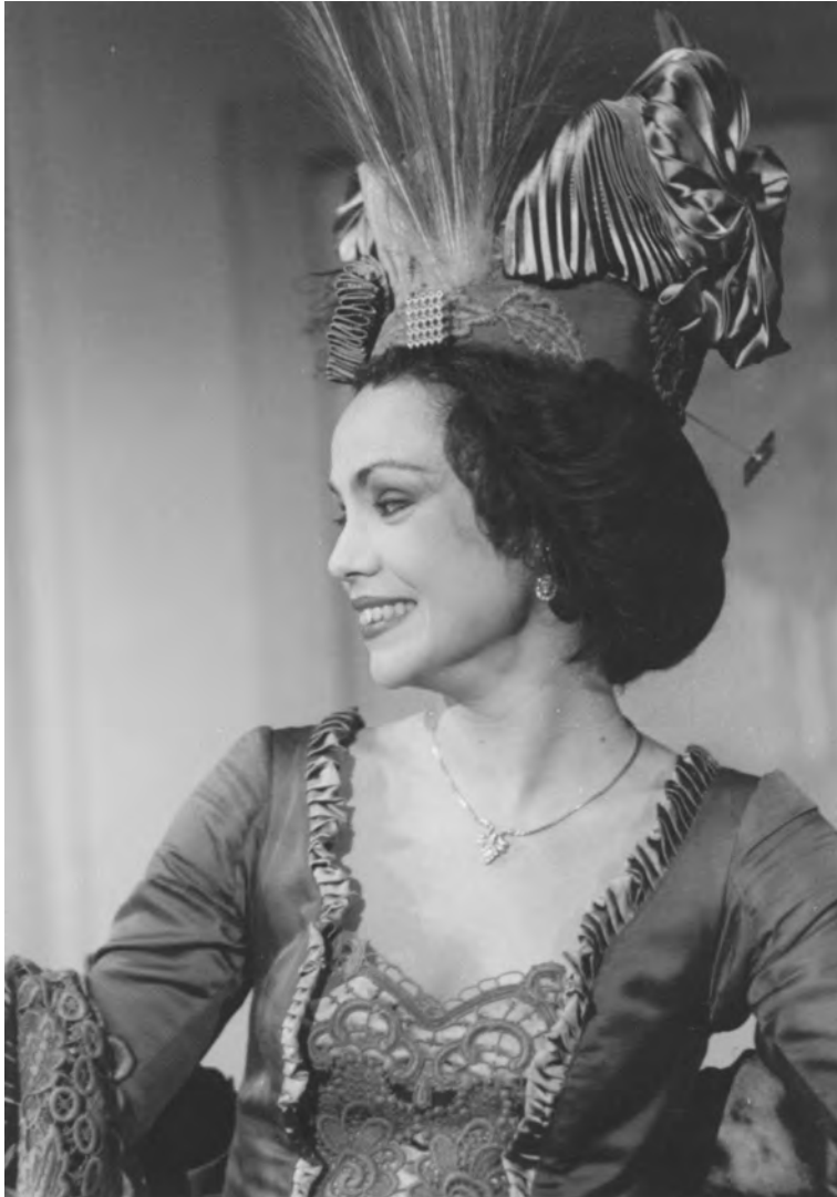
Αλεξάνδρα Σακελλαροπούλου Το καινούριο σπίτι, Εποχή