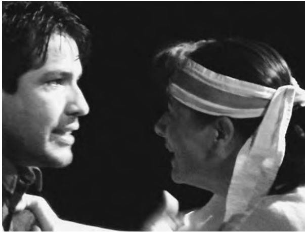
Αρχείο διεθνούς συνάντησης πανεπιστημιακών θιάσων αρχαίας Ολυμπίας, 2003