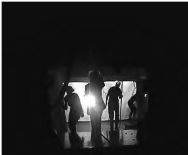
Τα γουρουνάκια κουμπάρδες, Εθνικό και Καποδιστριακό Πανεπιστήμιο Αθηνών Αρχείο Μ. Φραγκή